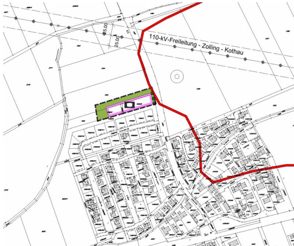
Ausschnitt aus 10. FNP-Änderung (o.M.)

und weiterhin Gültigkeit haben, werden für die betroffenen Bereiche unverändert übernommen.