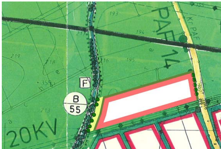
Ausschnitt aus rechtskräftigem FNP

Der rechtskräftige Flächennutzungsplan mit integriertem Landschaftsplan der Gemeinde Ernsgaden stellt die Flächen des Geltungsbereichs der Änderung als landwirtschaftliche Nutzfläche im Sinne des § 5 Abs. 2 Nr. 9 BauGB dar.